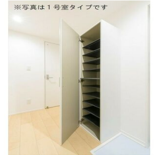
※写真は1号室タイプです