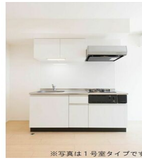
※写真は1号室タイプです